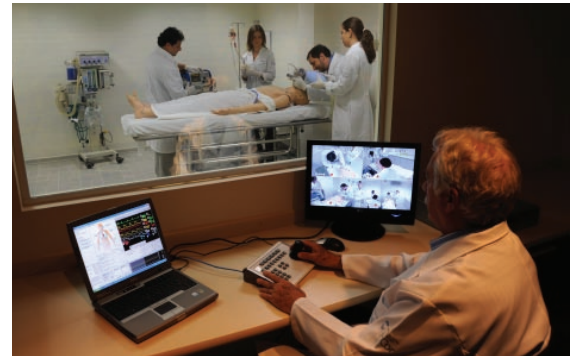
Sala de Controle do Cetes/HCor