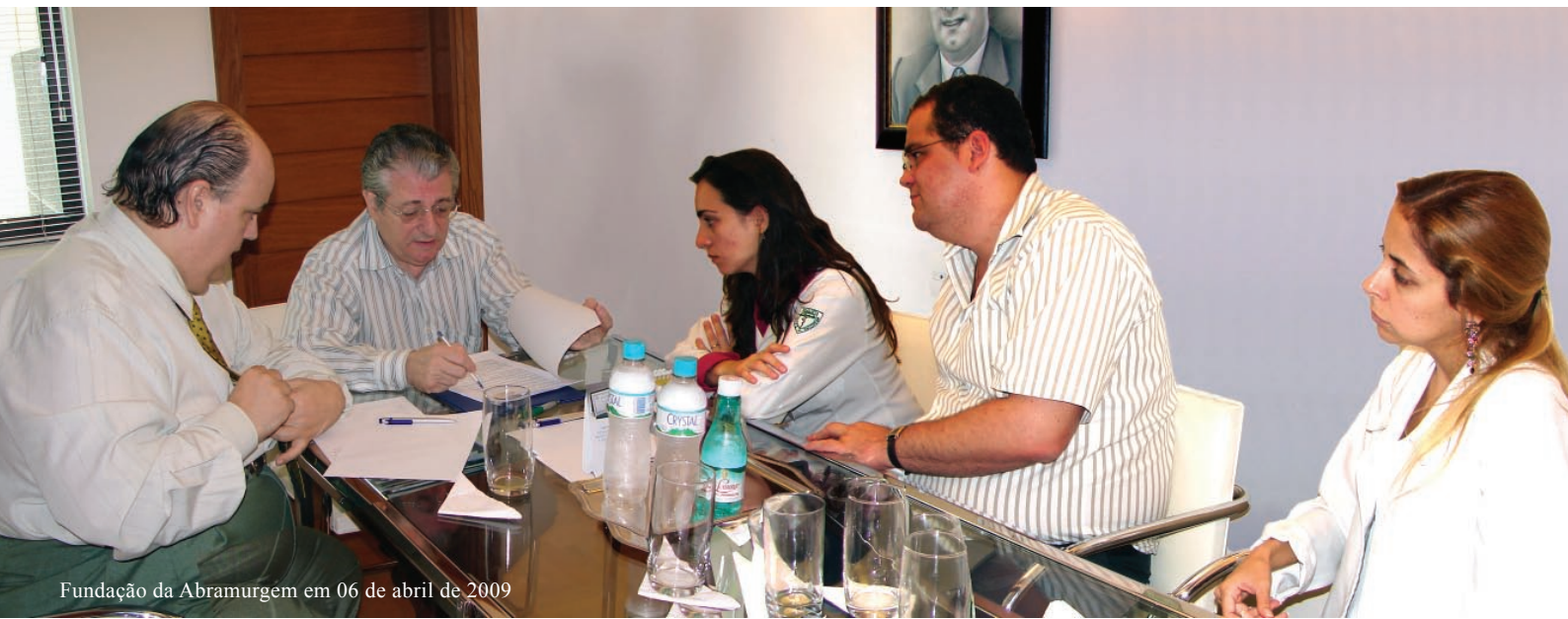
Fundação da Abramurgem em 06 de abril de 2009

Definido temário básico do 5º Congresso Internacional de Medicina de Urgência p. 2