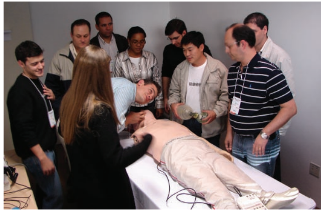
Aula de simulação de atendimento de urgência da Primeira Edição do Simurgem - 2008

também treinamento simulado do atendimento médico de urgência e emergência.