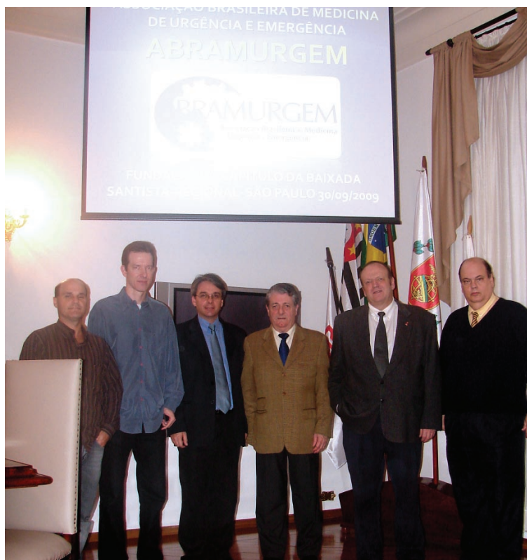
Fundação da Abramurgem capítulo Baixada Santista em 30 de setembro de 2009