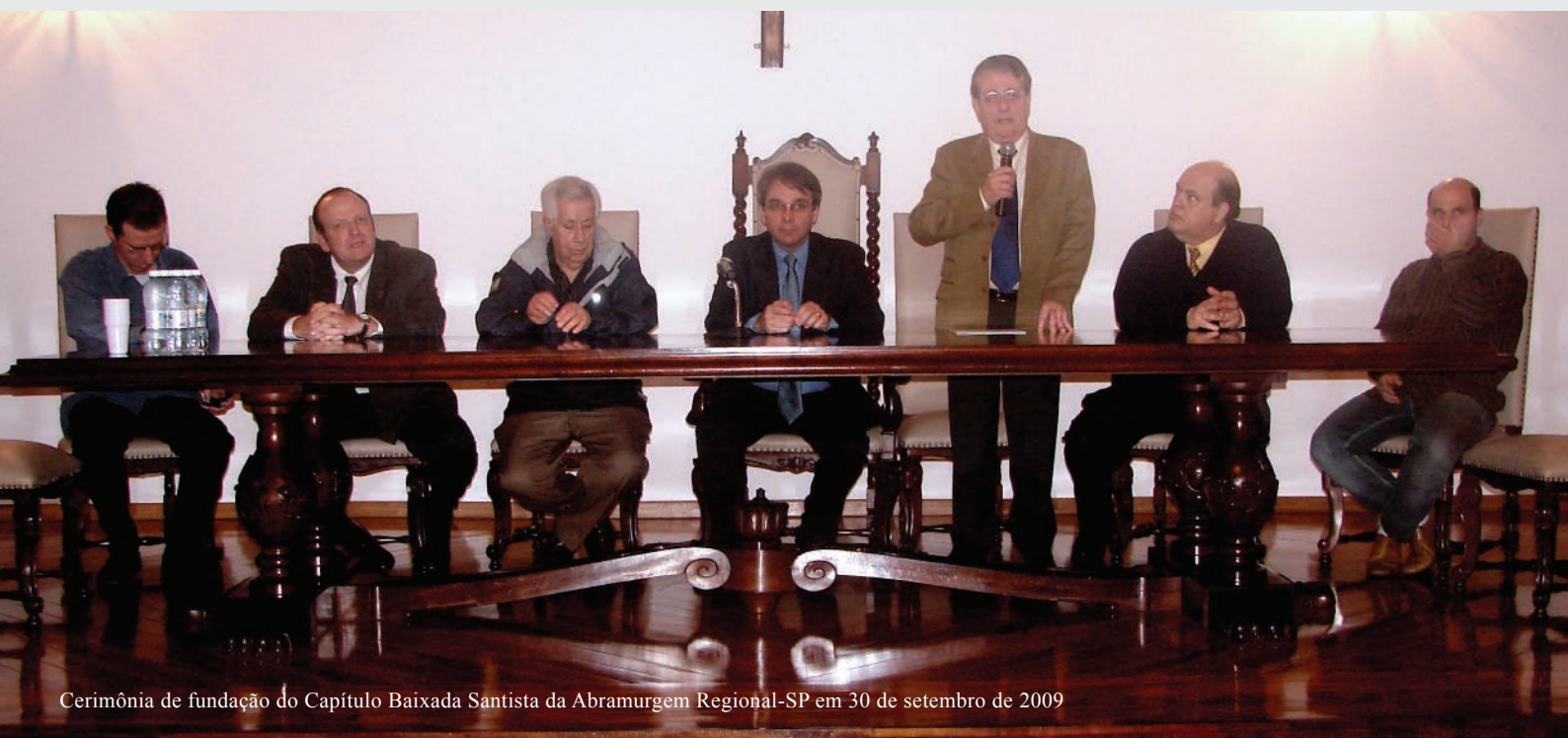
Cerimônia de fundação do Capítulo Baixada Santista da Abramurgem Regional-SP em 30 de setembro de 2009