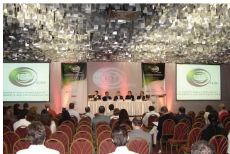
Abertura do II Simpósio Internacional de Trombose, realizado em São Paulo