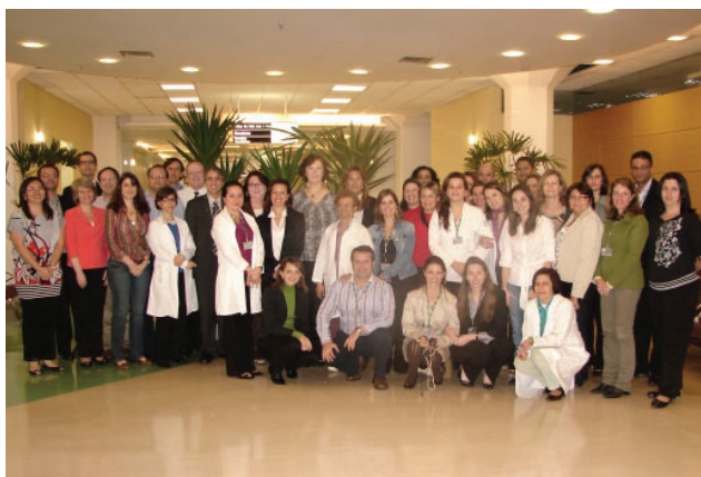
Participantes do "Anhembi Morumbi University Emergency Cardiovascular Care - Curriculum Design Forum"

Ao final do evento, os participantes produziram uma declaração sobre a inserção da urgência e emergência médica nos currículos das Faculdades de Medicina. Esse documento deve ser lançado em 2010 e terá chancela do American Heart Association , da SBCM, da Abramurgem e das demais instituições presentes.