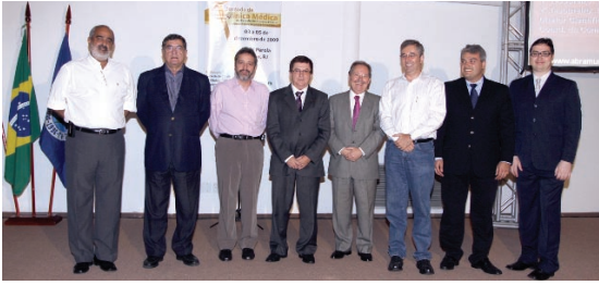
Membros da diretoria da Regional - RJ tomam posse durante a X Jornada de Clínica Médica do Estado do Rio de Janeiro

a trajetória da Sociedade Brasileira de Clínica Médica nos seus 20 anos de vida e sobre a fundação da Associação Brasileira de Medicina de Urgência e Emergência.