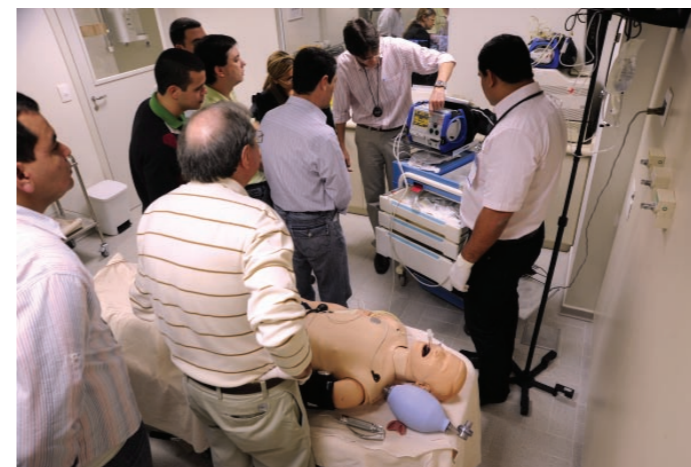
Alunos do Simurgem utilizam laboratório e equipamentos de alta tecnologia do CETES/HCor

As inscrições já estão abertas para a terceira edição do Curso de Simulação em Medicina de Urgência e Emergência (Simurgem), que acontece dias 14 e 15 de abril no Centro de Ensino, Treinamento e Simulação do Hospital do Coração (CETES/HCor), em São Paulo. O curso, promovido pela Abramurgem, SBCM e HCor, faz parte das atividades prelimina-