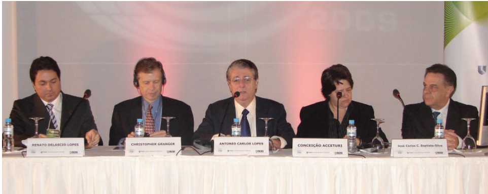
Mesa de abertura da segunda edição do Simpósio de Trombose e Anticoagulação, que reuniu 400 participantes em SP

Mais informações em breve no site www.sbcm.org.br .