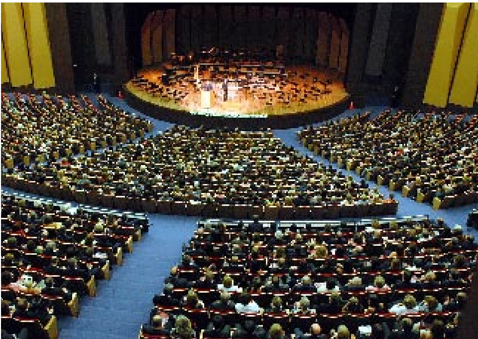
Interior do teatro do Expo-Unimed, que será sede do 11º Congresso Brasileiro de Clínica Médica

De 27 a 29 de outubro a Abramurgem irá realizar, na cidade de Curitiba (PR), uma série de debates que irão abordar temas de interesse dos profissionais que atuam nos pronto-socorros e salas de emergência. O evento está inserido na programação da 11ª edição do Congresso Brasileiro de Clínica Médica, para o qual são esperados mais de 5