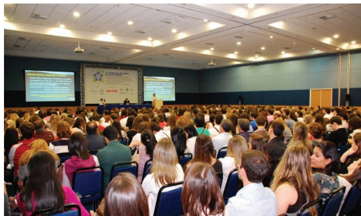
O evento, realizado em Curitiba (PR), reuniu mais de 5.500 congressistas