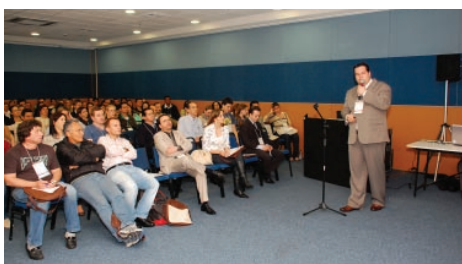
Curso de “Emergências Médicas Baseado em Casos Clínicos” teve mais de 230 inscritos

O dia 26 de outubro, que marcou o início dos trabalhos do 11º Congresso Brasileiro de Clínica Médica, foi dedicado à realização simultânea de cursos pré-congresso. Com programação consistente e atualizada, os cursos se caracterizaram pelo sucesso de público. Os mais procurados foram “Emergências Médicas Baseado em Casos Clínicos”, com 238 inscritos e “Medicina Ambulatorial”, que teve 184 participantes, seguidos por “Grandes Síndromes – Significância Clínica e Desfechos”, cujo público somou 147 pessoas, “Perícias Médicas”, que teve 104 inscritos, e “Geriatría para o Clínico”, com 76 participantes.