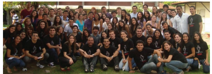
Participantes do 3º Curso Teórico-Prático em Urgência e Emergência

Nos dias 04 e 05 de novembro a LAUEP, Liga Acadêmica de Urgência e Emergência da Universidade do Estado do Pará, realizou o módulo básico do 3º Curso Teórico-Prático em Urgência e Emergência, que contou com a participação de 60 alunos. Os temas abordados foram Semiotécnica do Trauma, Medicamentos Básicos na Urgência, Interpretação do Hemograma, Radiologia no Pronto Atendimento, RCPC - Atualização do Protocolo, Atendimento do Politraumatizado, Injetáveis e Técnicas de Síntese.