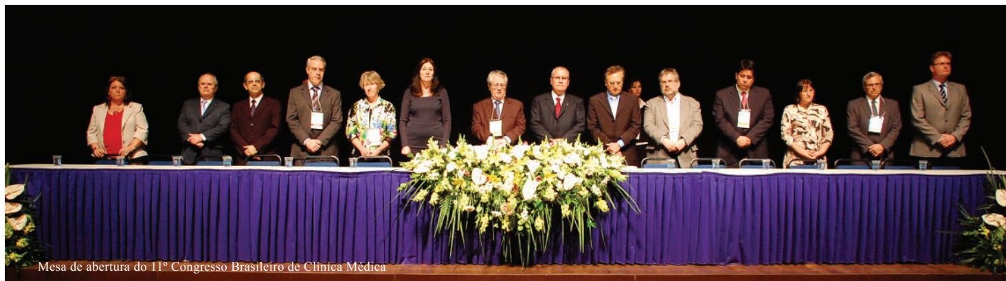
Mesa de abertura do 11º Congresso Brasileiro de Clínica Médica

A cidade de Curitiba (PR) foi palco da 11ª edição do tradicional Congresso Brasileiro de Clínica Médica, que aconteceu no Expo-Unimed/Universidade Positivo de 26 a 29 de outubro de 2011. O evento, que teve como atividades paralelas o 1º Simpósio Nacional de Medicina de Urgência e Emergência, o 5º Congresso Nacional das Ligas Acadêmicas de Clínica Médica, a 1ª Jornada Nacional de Medicina Diagnóstica e Exames Complementares, e o Annual Meeting do Capítulo Brasileiro do American College of Physicians, foi marcado pelo recorde de público, contabilizando 5.525 congressistas inscritos. De acordo com o Prof. Dr. Antonio Carlos Lopes, Presidente da Sociedade Brasileira de Clínica Médica e Presidente de Honra do Congresso, é a primeira vez que um evento desse porte realizado fora de São Paulo recebe um número tão grande de participantes. “Podemos encontrar aqui em Curitiba essa infraestrutura maravilhosa que favoreceu em todos os aspectos a realização deste congresso. Estamos impressio-