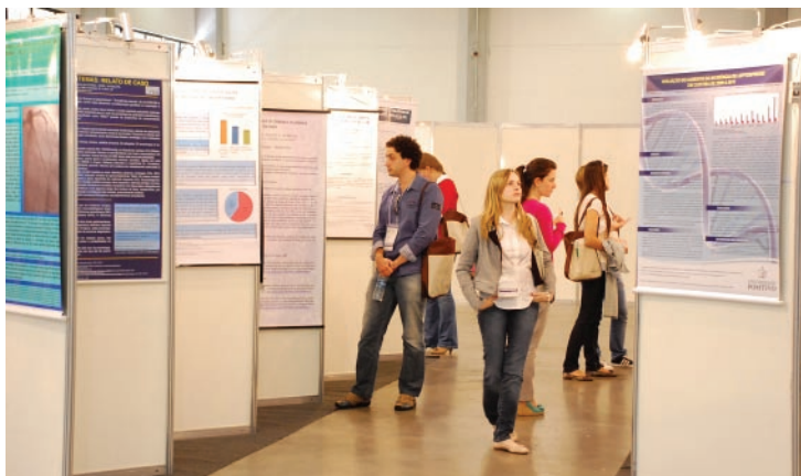
Mais de 800 trabalhos de tema livre foram apresentados oralmente e em forma de pôster