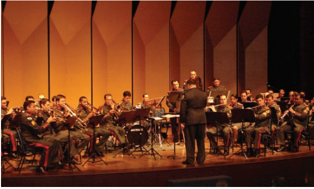
Corporação Musical da Polícia Militar do Paraná se apresenta durante abertura do congresso