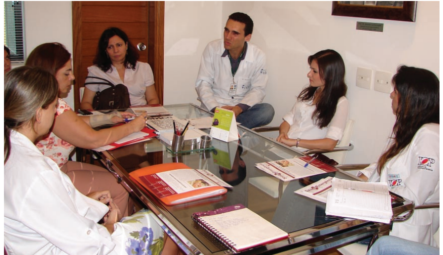
Membros dos comitês de Fisioterapia e Enfermagem da Abramurgem Regional-SP se reúnem com o Presidente da entidade para debater novos cursos e eventos

No último dia 14 de fevereiro a nova diretoria da Abramurgem Regional-SP esteve reunida em assembleia na sede da entidade para aprovar a criação dos comitês de Fisioterapia e Enfermagem. Na ocasião, foram eleitos os novos membros desses comitês, que serão incumbidos de promover e difundir cursos e atividades relacionadas à Urgência e Emergência em suas respectivas áreas.