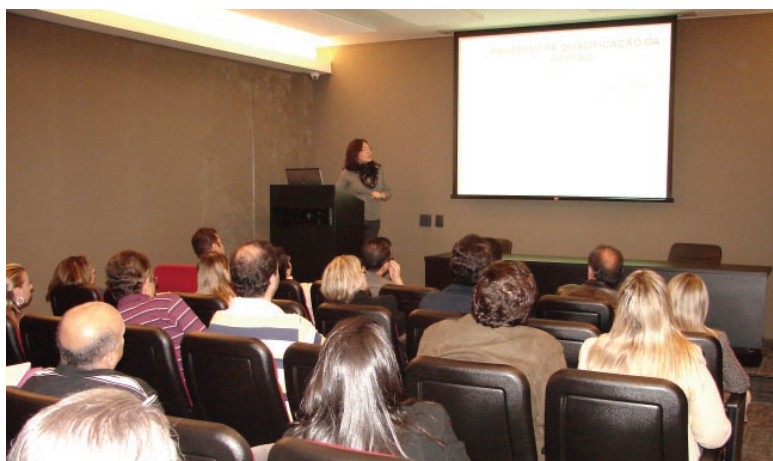
Curso de Pós-Graduação em Urgência e Emergência em São Paulo: alunos durante o primeiro dia de aula

No último dia 21 de julho tiveram início, em São Paulo (SP), as atividades do Curso de Pós-Graduação em Medicina de Urgência e Emergência, chancelado pela Abramurgem e promovido pelo IPATRE (Instituto Paulista de Treinamento e Ensino). Com duração de 2 anos, os alunos participarão de 18 módulos de aulas teóricas e práticas, incluindo mini-cursos de imersão. Reconhecido pelo MEC, esse curso tem como objetivo central contribuir para a formação e capacitação dos profissionais médicos que trabalham nas unidades de emergência, prontos-socorros e atendimento pré-hospitalar.