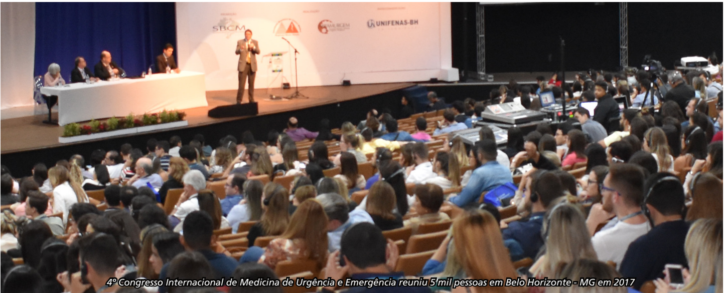
4º Congresso Internacional de Medicina de Urgência e Emergência reuniu 5 mil pessoas em Belo Horizonte - MG em 2017